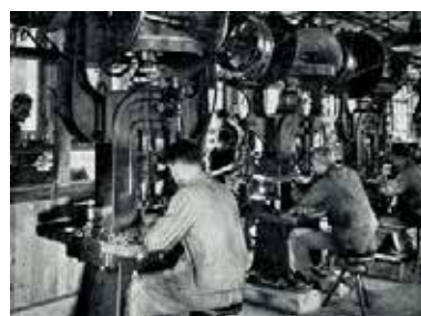
Etampage, groupe de balanciers