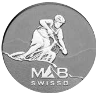
Thématique Mountain bike VTT