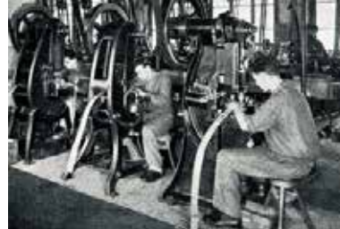
Etampage petites presses

Située au cœur des compétences et de l'excellence du monde horloger suisse, la marque Marcel Bouvier est la renaissance d'un savoir-faire de plus d'un siècle, l'application des valeurs de feu Marcel Bouvier et l'inspiration de l'élégance mythique de Jackie Bouvier-Kennedy.